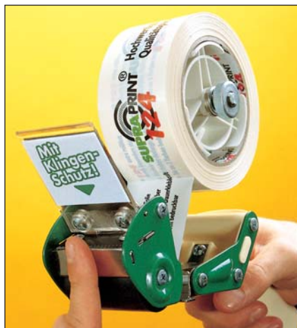
Der Handabroller MT 50 S mit Sicherheitsmesser

Hektik im Versand: Die Ware muss raus, schnell noch ein Paket verschließen, ein Griff zum Handabroller auf dem Packtisch - und schon kann das Malheur passiert sein. Der Mitarbeiter hat ins Messer des Handabrollers gegriffen. Mehr Sicherheit an der Packstelle bietet ein Handabroller mit Klingenschutz.