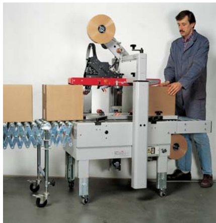
Auf Knopfdruck lassen sich pro Stunde bis zu 1.200 Kartons maschinell verarbeiten.