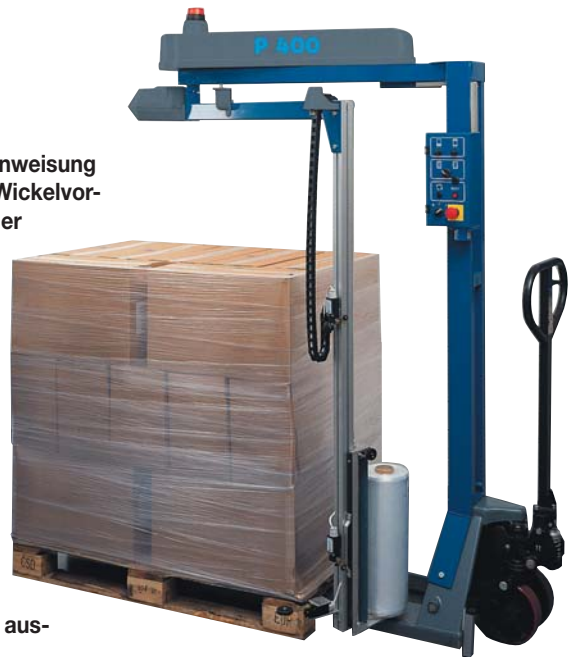
Der neue Hubwagen-Stretcher P 400: Eine Systemlösung für platz-, material- und zeitsparendes Stretchen.

Die Maschine kann auf eine Vorrekanlage verzichten und damit preisgünstiger kalkuliert werden, denn sie läuft mit vorgereckten Folien.