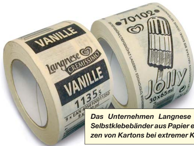
Das Unternehmen Langnese setzt im Versand Selbstklebebänder aus Papier ein, um das Aufplatzen von Kartons bei extremer Kälte zu verhindern.

Selbstklebendes Papierpackband stellt somit eine hervorragende Lösung dar, wenn extreme Temperaturen auf den Karton und somit das Band einwirken. Seine Geschmeidigkeit gewährleistet einen sicheren Verschluss auch bei sibirischen Temperaturen, wo andere Bänder längst passen müssen.